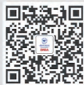
找到你的学习组织