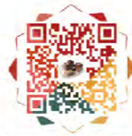
浙江大学管理学院新大楼主题捐赠计划