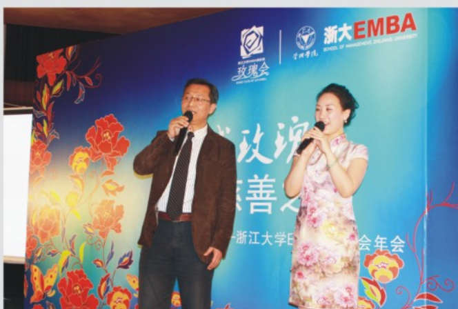
▲ 管理学院领导与玫瑰会员联袂演唱

代女企业家自尊、自信、自立、自强的精神风貌。相信通过她们的善举，必将影响更多的人参与到我国的慈善事业中，在构建和谐社会的道路上，贡献出自己的一份力量。这也是浙江大学管理学院作为商学院一直所倡导的价值观和企业家精神。