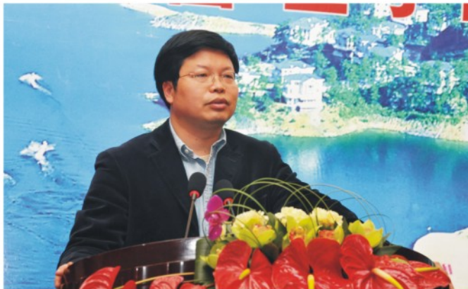
▲ 应飏书记主持15日下午会议并作学院思想文化建设报告