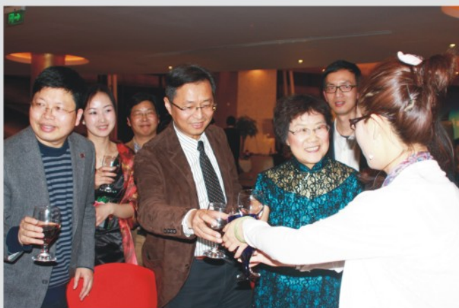
▲ 管理学院领导与玫瑰会员们举杯共饮

慈善是爱心的体现，能使人的心灵得到升华。举办慈善晚会就是希望影响更多的人参与慈善事业。用行动去唤起更多的企业家们去关心社会，关爱弱势群体，通过浙江大学EMBA俱乐部玫瑰会的活动，通过她们的爱心和善举，展示出中国新一