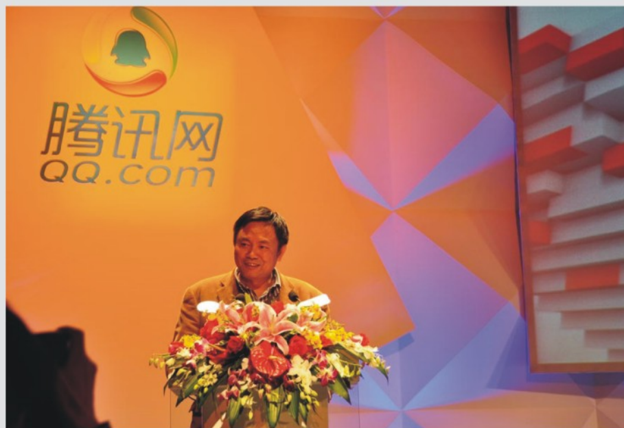
▲ 颁奖嘉宾: 国务院学位委员会办公室主任、原教育部高教司司长张尧学

获得2010中国十大教MBA育学院的分别是: 清华大学经济管理学院、复旦大学管理学院、浙江大学管理学院、中国人民大学商学院、同济大学经济与管理学院、暨南大学管理学院、中山大学管理学院、四川大学工商管理学院、对外经济贸易大学国际商学院、北京航空航天大学经济管理学院。